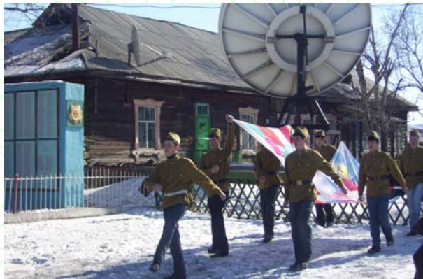
Акция «Солдатский платочек»