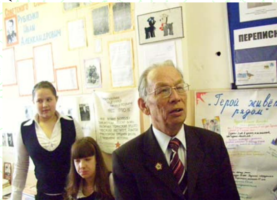
Открытие школьного музея